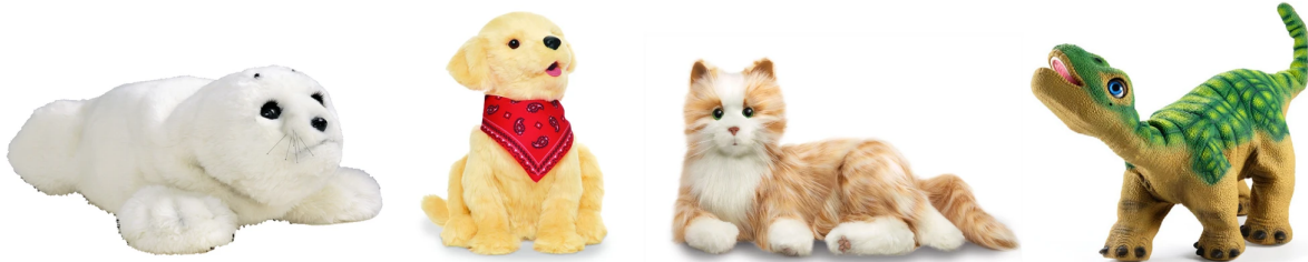
Figuur 4: Robots van de bevraging door Bradwell et al. (2020), CC BY 4.0.

Je kan je les ook starten met een artikel of een radiofragment: