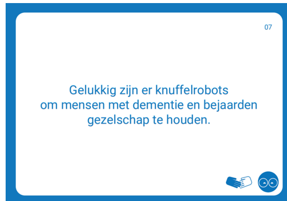
Figuur 1: Kaart 7 uit de kaartenset.