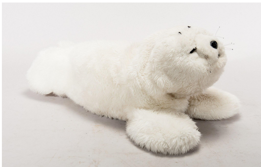
Figuur 2: Peter Häll. Paro. Tekniska Museet.

Knuffelrobots, zoals Paro in Figuur 2, zijn gezelschapsrobots. Ze worden ingezet om mensen met dementie en bejaarden gezelschap te houden.